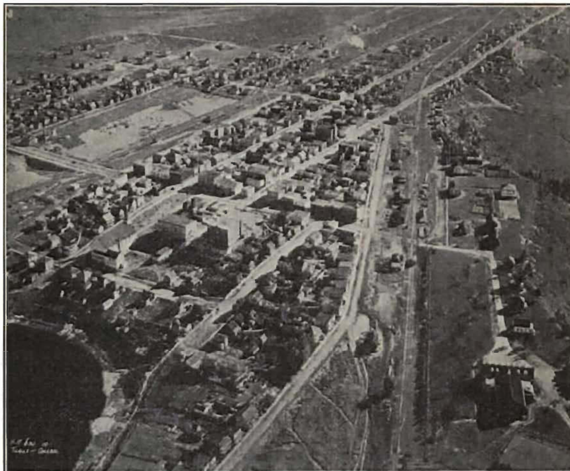
Figure 6 Vue aérienne de La Tuque vers 1929

On aperçoit la partie sud de la rue Berkler et le Brown Community Club à droite.