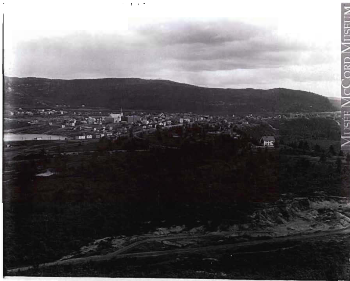
Figure 5 Vue de La Tuque vers 1916