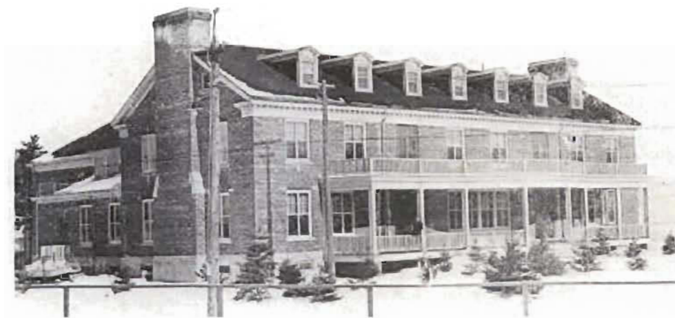
Figure 3 Le Brown Community Club en 1922