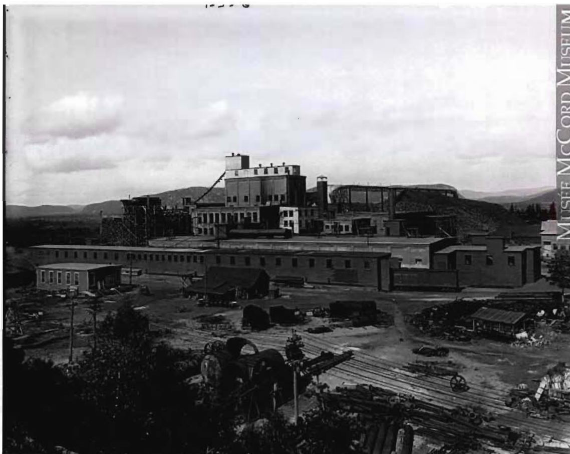
Figure 7 Usine de la Brown Corporation vers 1916