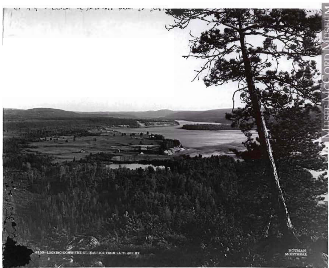
Figure 4 Vue du site de La Tuque vers 1906